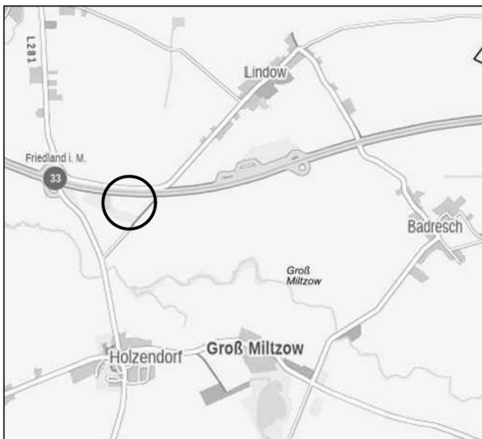
Übersichtsplan

Das Plangebiet umfasst das folgende dargestellte Gebiet: