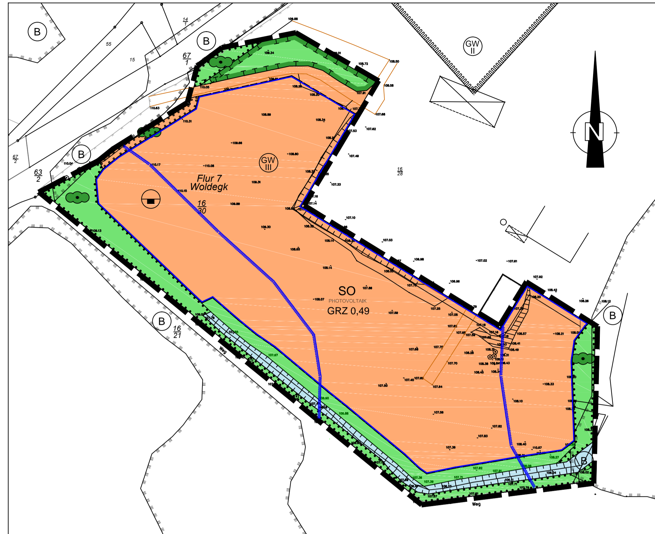
Kartengrundlage Lage- und Höhenplan Vermessungsbüro Buse 01/2018